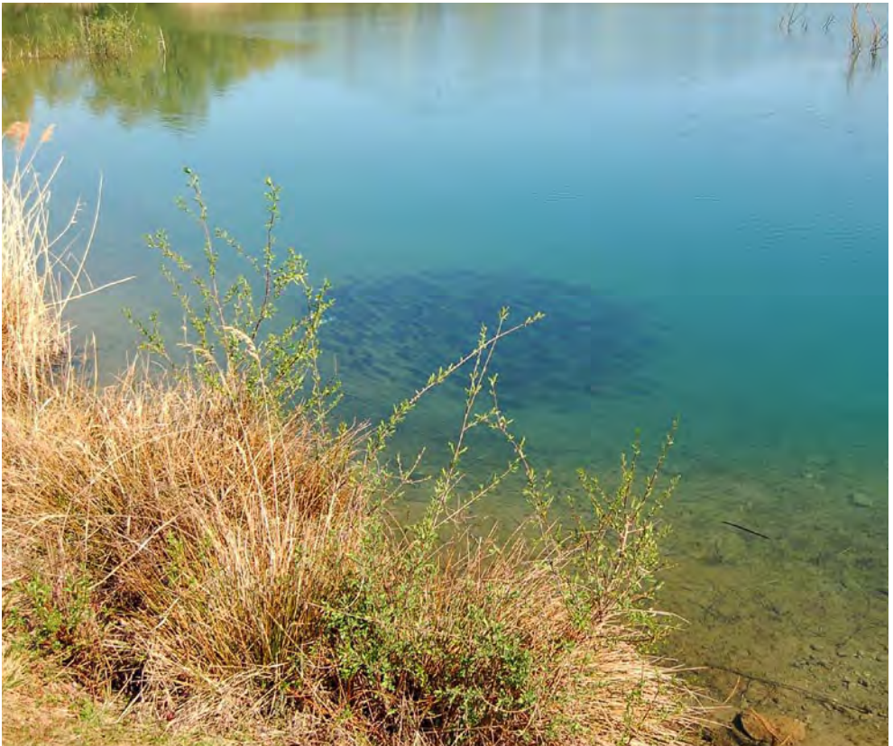
Rotaugenschwarm vor dem Vereinsheim